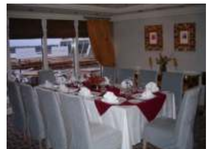
Todd English Spezialitäten Restaurant