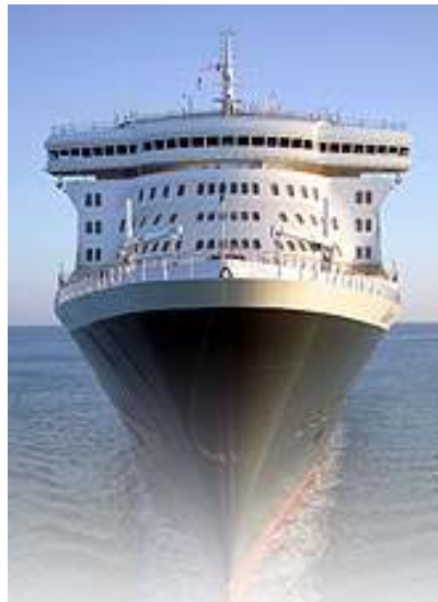
QM2 - Das neue Flaggschiff der Reederei Cunard