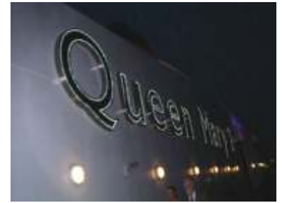
Queen Mary 2 bei Nacht an Deck