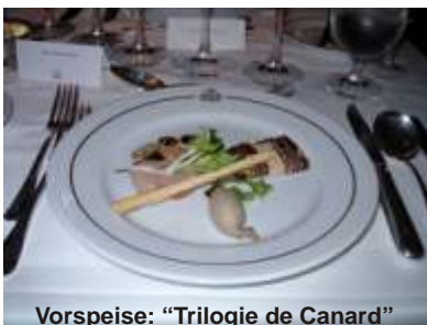
Vorspeise: "Trilogie de Canard" im Britannia Restaurant