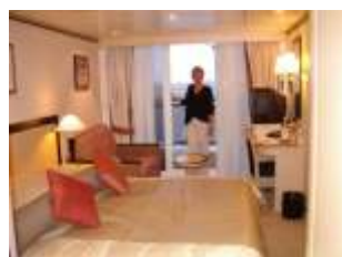
Deluxe Kabine mit Balkon