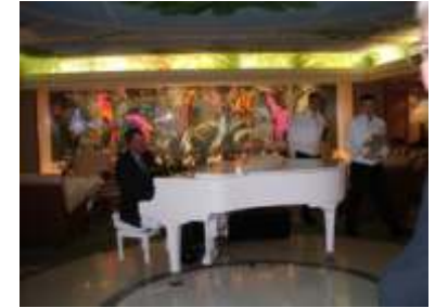
5 O'Clock Tea im Wintergarden