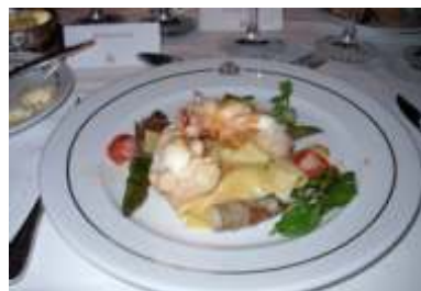
Hummerschwanz an Champagner Sauce, Bandnudeln, Grüner Spargel